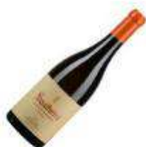
Soalheiro Alvarinho Reserva Branco 2015