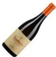
Soalheiro Alvarinho Reserva Branco 2015

Em alternativa, temos vinhos brancos , com estrutura, madeira discreta com maceração parcial, menos acidez e mais redondos.