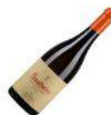
Soalheiro Reserva Alvarinho Branco 2016

E agora junte amigos ou família, desfrute e partilhe a experiência !