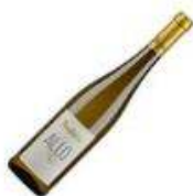
Allo Alvarinho Loureiro Branco 2017