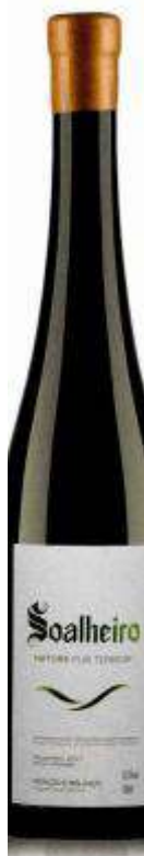
Alvarinho Nature, Quinta de Soalheiro Preço: € 16