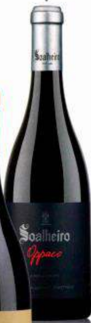
Oppaco Vinhão e Alvarinho, Quinta de Soalheiro Preço: € 16