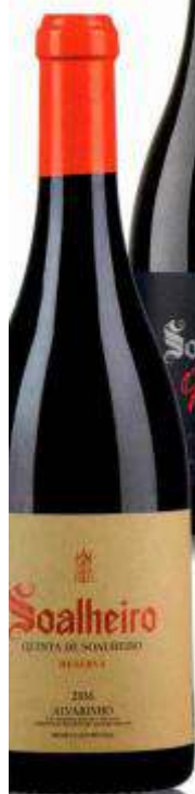
Alvarinho Reserva, Quinta de Soalheiro Preço: € 24