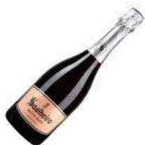
Espumante Soalheiro Bruto Rose

A cavala é um peixe gordo mas delicado, que requer um vinho frutado, de boa acidez, estrutura ligeira e comprimento final de nota médio, para podermos conjugar.