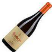
Soalheiro Reserva Alvarinho Branco 2016