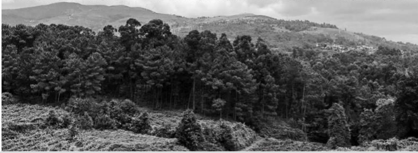
Quinta da Folga, um cenário idílico, propriedade da Casa Soalheiro, uma das marcas mais conceituadas da região dos vinhos verdes

A região está a crescer, está a trabalhar em qualidade e de forma evolutiva, o que deixa enormes perspectivas para o futuro.